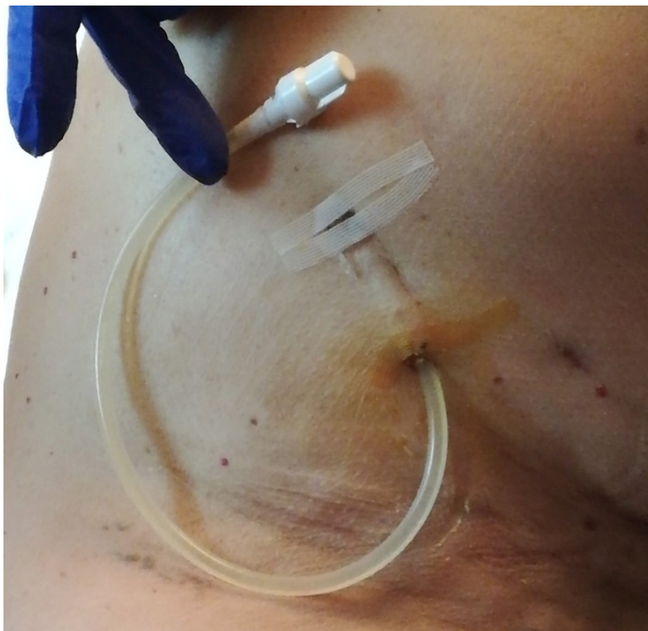
Imagen 2. Extremo distal del catéter pleural tunelizado en la pared torácica de la paciente

En nuestro caso, a pesar de que la paciente presentaba un pulmón reexpandible tras el drenaje del líquido pleural, los intentos de pleurodesis con talco fracasaron, y ante la presencia de derrame pleural rápidamente recidivante, se optó por la colocación de un catéter tipo PleurX®. Se trata de un catéter de silicona flexible de 66 cm de longitud y 15.5 French de grosor, fenestrado que se introduce en la cavidad pleural con anestesia local y se tuneliza a través del tejido celular subcutáneo (Imagen 2). La porción distal a la pared torácica finaliza en una válvula unidireccional de seguridad que sólo se abrirá, permitiendo el drenaje del líquido, cuando es conectada a una botella de vacío de hasta 1 litro de capacidad.