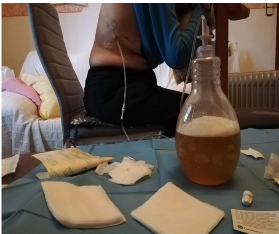
Imagen 3. Drenaje del líquido pleural en el domicilio de la paciente. Se aprecia el líquido en la botella de vacío

Este procedimiento representa una alternativa para el manejo del derrame pleural maligno, diseñado para que el paciente, instruido en la técnica, pueda drenarse el líquido pleural en su propio domicilio a medida que aparezcan los síntomas. De esta forma se evitarán traslados a centros hospitalarios permitiendo una mejoría en la calidad de vida (8,9). Aunque es una técnica diseñada para que el propio paciente pueda realizarla, consideramos que al tratarse de pacientes con enfermedad maligna avanzada y en muchos casos con un deterioro funcional significativo, se pueden beneficiar de la participación de equipos de soporte domiciliario para el manejo integral del paciente, ya que se debe tener en cuenta que los síntomas que pueden presentar no siempre serán atribuibles, de forma exclusiva, a la afectación pleural.